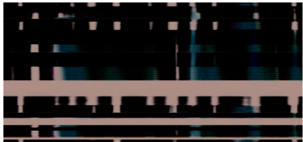
Img_04 C.H.I.K.I [USA]