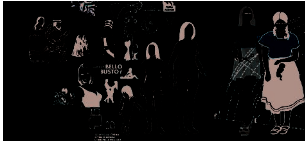
Img_03 Xnografikz [Mexique]