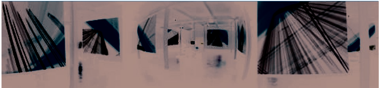
Img_07 Installation Voice spa[z]e, (Belgique)