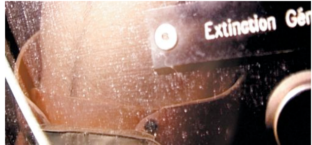
Img_02 Komabox [France]

Le Mapping festival est une manifestation présentant des artistes de l'image et du son, dans le domaine émergent du VJing *