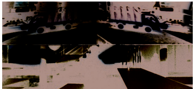
Img_05 Lomography VJ's [autriche]